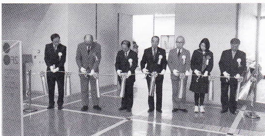
オープニングセレモニーにおけるテープカット

準備・運営にご協力いただいた能美市や石川県立美術館の皆様方、本当にありがとうございました。